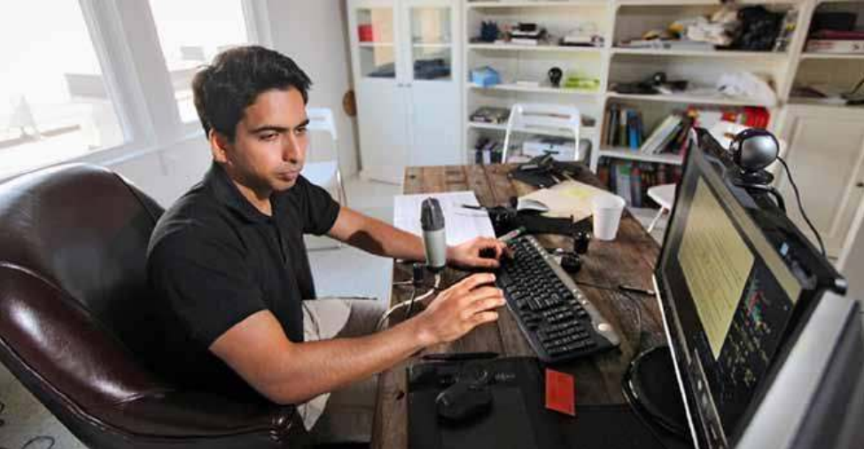
☛ സൽമാൻ ഖാൻ വീഡിയോ ക്ലാസ് തയ്യാറാക്കുന്നു

ക്ളാസെടുക്കുന്ന അദ്ധ്യാപകൻ ഇന്ന് പഴഞ്ചരക്കാണ്. പുതിയ കാര്യം വല്ലതും പറയാനുണ്ടോ, എങ്കിലേ സാറന്മാരുടെ കൂടെ പിള്ളാരൂ കാണൂ. അത്യാം ഓൺലൈനിൽ പറഞ്ഞാൽ മതി. ഐപാഡിലോ ടാബ്ലറ്റിലോ സൗകര്യം പോലെ സാറിനെ കേട്ടോളാം. ഇങ്ങനെ പഠിപ്പിച്ചാൽ എത്ര പിള്ളേരു കാണുമെന്ന ചോദ്യത്തിനുള്ള ഉത്തരമാണ് സൽമാൻഖാന്റെ ട്യൂട്ടോറിയൽ.